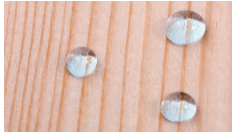
Hout behandeld met WOODSEAL PRO